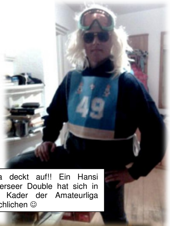
Olga deckt auf!! Ein Hansi Hinterseer Double hat sich in den Kader der Amateurliga geschlichen ☺