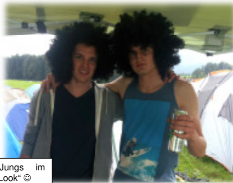
Die Thara-Jungs im neuen „Afro-Look“ ☺