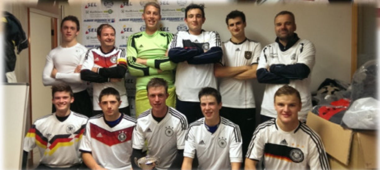
Jogi „Pitzinger“ Löw konnte mit seiner bundesdeutschen Kampftruppe im Trainingsspiel gegen die blauen „bunga bunga“ Jungs klar als Sieger vom Platz gehen ☺