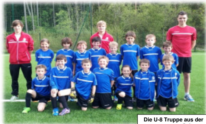
Die U-8 Truppe aus der vergangenen Saison