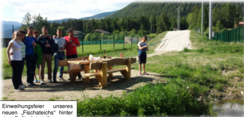
Einweihungsfeier unseres neuen „Fischateichs“ hinter dem Fußballplatz ☺