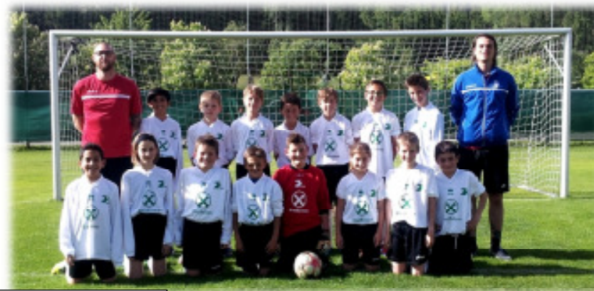
Die U-10 Mannschaft der Saison 2013/2014