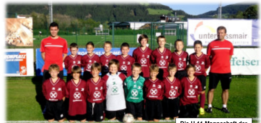
Die U-11 Mannschaft der Saison 2013/2014

Die Trainingseinheiten finden jeweils dienstags und donnerstags von 17.15 Uhr bis ca. 18.30 Uhr statt. Die Heimspiele finden samstags nachmittags in Olang statt.