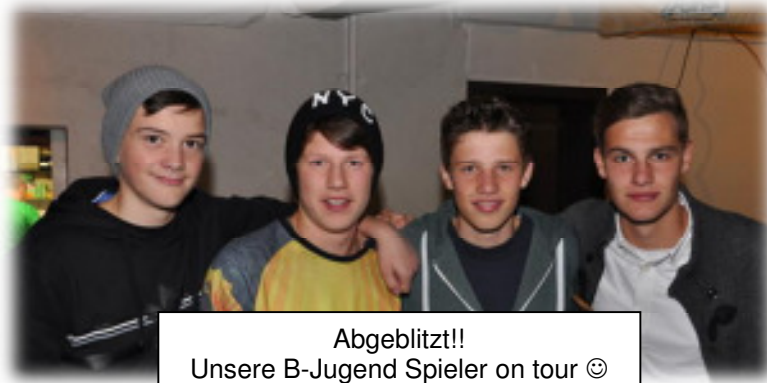
Abgeblitzt!! Unsere B-Jugend Spieler on tour ☺