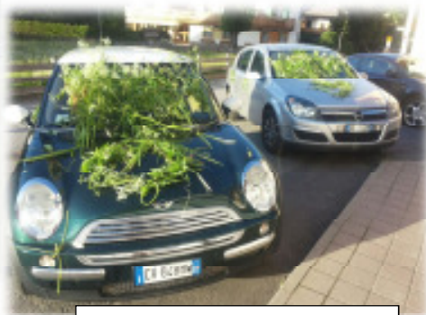
Zum Abschluss der B-Jugendsaison bedankten sich die Spieler bei Germar und Michl mit „Blumen“ ☺